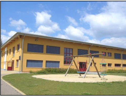
Serbska zakladna šula Ralbic